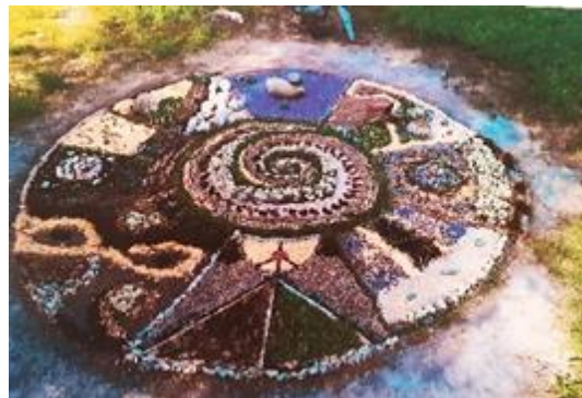
Kreiert von Bernd Shonubi